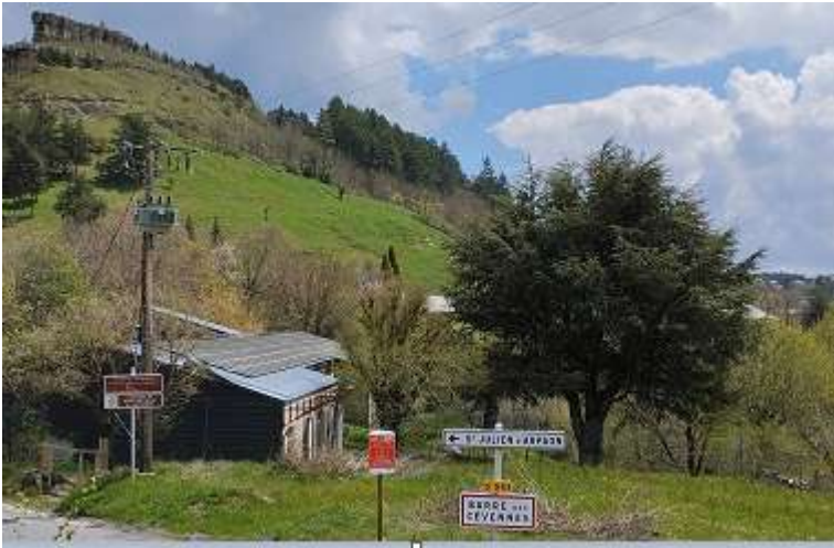
Cèdre du Liban en B536